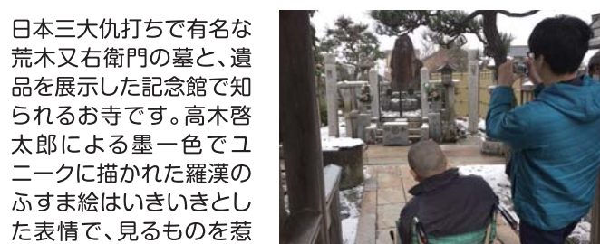
荒木又右衛門の墓

げんちゅうじ 鳥取市新品治町176 ⑫玄忠寺 ☎ 0857-22-5294 時 9:00~16:00 休 1/1~3、春分の日、8/12~15・20 料 拝観料 500円 秋分の日