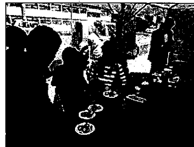
イベント（しいたけ網焼き試食）