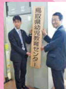
「鳥取県幼児教育センター」開所式 平成29年4月6日

市町村、幼稚園・保育所・認定こども園、小学校等の教職員を対象に、 4つの内容 を柱に取組を推進します。