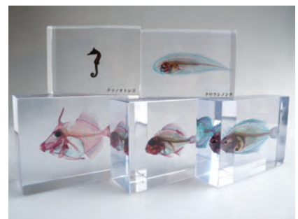
写真4. アクリル樹脂で封入された魚類の透明骨格標本