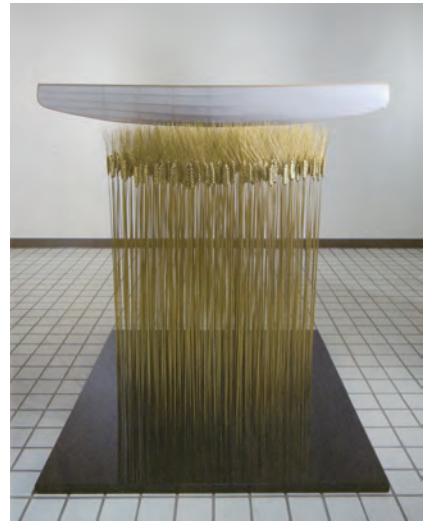
2003年 紙、木、真鍮、花崗岩 130.5×118.0×100.0cm

今回収蔵した《時の記憶》は近年井田が取り組んでいる新しいシリーズです。これまで用いられてきた花崗岩は台座の部分のみに使用され、真鍮と和紙、木という素材が用いられています。一見してわかるとおり、黒い台座から真鍮製の麦の穂が上に向かって無数に伸び、その上に和紙と木を用いて制作された船が置かれています。複数の素材が使用され、和紙の白、真鍮の金、台座の黒という色彩の対比が鮮やかな点はこれまでの作品と異なりますが、船のかたちが使用され、寓意性が強い点は共通し、造形的な完成度も一段と高くなっています。井田はこの作品について