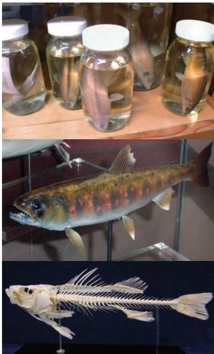
写真1. (上) 様々な魚類の液浸標本 (中) アマゴ剥製標本 (下) スズキ骨格標本

剥製標本は魚の皮だけを残し、型にかぶせるなどして整形したものです。表面の色彩は保存されないのので、通常は生きていたときの様子を元にして、人の手で着色されます。そのため、できればは作り手の技術やセンスに大きく左右されてしまいます