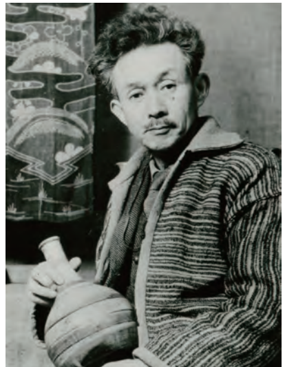
写真1 柳宗悦肖像 日本民藝館にて 1951年

さらに、鳥取で開催される本展では、独自の展示として、柳宗悦の影響を強く受けた吉田璋也(鳥取)、太田直行(松江)などの山陰の民芸運動の活動家や職人らと柳との交流