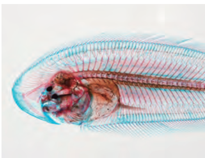
写真3. クロウシノシタの透明骨格標本 (前半部拡大)