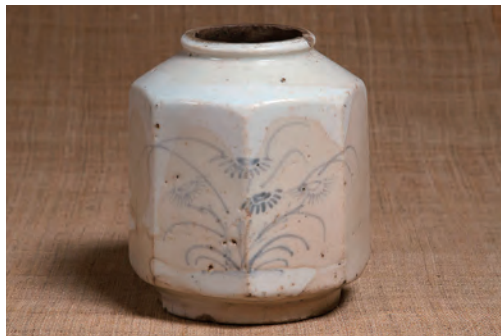
写真2 《染付秋草文面取壺》朝鮮半島 18世紀前半 日本民藝館蔵

武者小路実篤や志賀直哉らとともに雑誌『白樺』を創刊し、旺盛な執筆・編集活動を行っていた柳宗悦は、朝鮮の陶磁器[写真2]などとの出会いをきっかけに、無名の職人たちの手が生み出す日用の雑器に美を見出します。そして、同志らとともにそれらを「民衆的工芸=民芸」と名付け、その再評価と保存・展開を目指す「民芸運動」を創始、カリスマ的な吸引力でそれを主導しました。柳はその活動の拠点として、1936年10月、東京・駒場に日本民藝館を開設、独自の審美眼によって精力的に収集した古今東西の逸品を公開