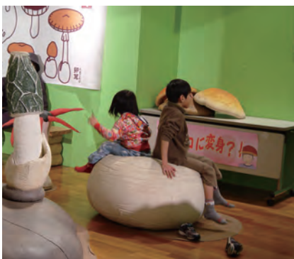
きのこの森で遊ぼう!(展示イメージ。ミュージアムパーク茨城県自然博物館2005年企画展の様子。)