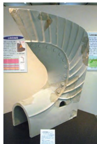
写真2:新たな復元レプリカ

しかし、かなり大型であることや鱗部に屈曲があることなどに違和感を覚え、ある時改めて破片を観察しました。その結果、破片は2個体分があり、これまでの復元は2個体を1個体としたことにより誤っていたことが判明しました。そこで、昨年度に復元をやり直し、新たにレプリカを製作しました(写真2)。全高、最大幅とも20cm程度小さくなりましたが、伸びやかですっきりとした形に復元できました。