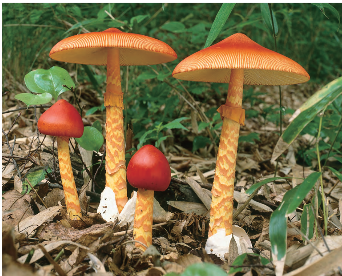
タマゴタケ(1989年)