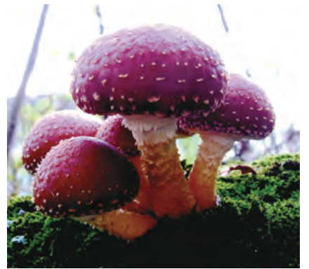
博物館のすぐ裏に生えていたヌメリシギタケ