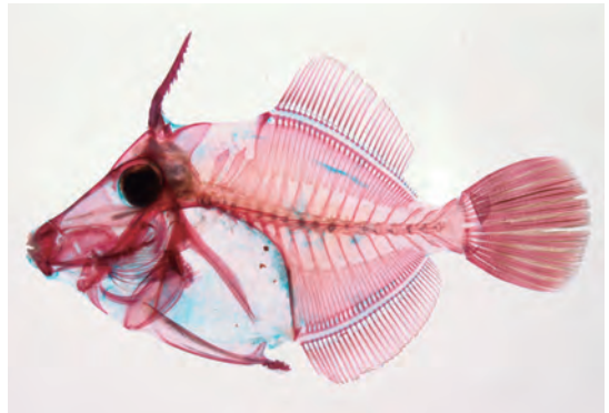
写真2. カワハギの透明骨格標本

これは魚体の筋肉を酵素やアルカリなどの薬品で透明化し、染色液で硬骨を赤紫色、軟骨を青色に染めたものです。これによって小さな骨や軟骨までも、生きていたときの配置や向きのまま、保存・観察することができます。たとえば写真2では顎の複雑な構造を観察することができ、写真3では体の辺縁部のヒレを構成す