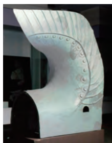
写真1:旧復元レプリカ

さて、当館では玉鉾等ヶ坪廃寺(鳥取市国府町)から採集された山陰型鴟尾の破片を所蔵しています。開館時にこれを基にして復元レプリカを製作