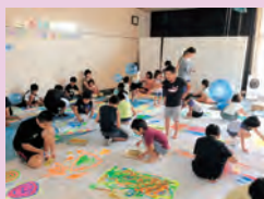
中浜公民館でのワークショップの様子

年に2回程度、県内の展示施設にて当館の所蔵作品を紹介する展覧会を開催します。最近では、智頭町石谷家住宅、北栄町北条歴史民俗資料館等で実施し、この秋には、日南町美術館にて洋画の展覧会を開催します。