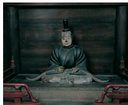
池田忠継坐像(岡山市・清泰院蔵)