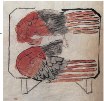
雉子献上の様子(当家贈物覧(鳥取県立博物館蔵))

献上品は、毎月鳥取・江戸間を陸路で輸送されるため日持ちのする塩漬や干物でした。しかし、その途次、献上品が傷む可能性もあったため、江戸へ輸送される量は献上される量の数倍から数十倍に及びました。例えば5月に献上された「塩雉子」はオス5羽を献