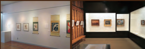
過去の移動美術館の様子

会期：平成29年 9月24日(日)～10月8日(日) 開館時間：8:30～17:00 (入館は16:30まで) 休館日：会期中の月曜日 会場：日南町美術館 (日野郡日南町霞785)