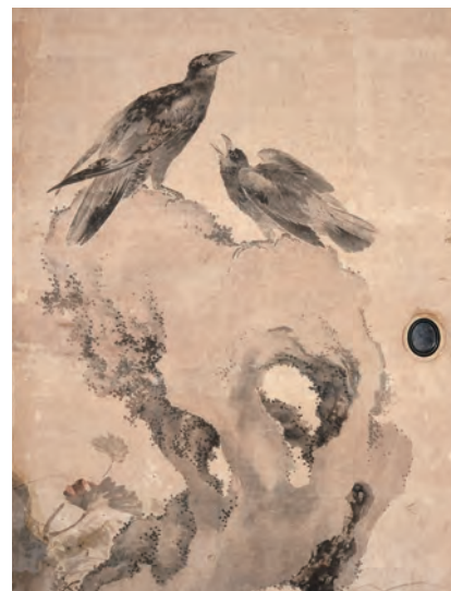
土方稲嶺筆《興国寺伝来 岩に鳥図》(部分)

山門、法堂、禅堂、開山堂、庫裏、書院など立派な伽藍が広がります。この書院にはかつて、鳥取画壇の祖とも言われる土方稲嶺(1741～1807)が筆を揮った襖絵がはめられていました。八畳敷が四間あり、床と違い棚、付け書院を備えた庭を臨む一之間には山水図が、二之間には竹林七賢図が、手前の三之間と四之間には鯉や鳥などが描かれた花鳥図が画題として選ばれており、襖絵の総数は三十八面を数えます。寛政八年(1796)、稲嶺が鳥取藩絵師として召し抱えられる二年前の、京都を中心に活動していた時期の制作と判明し、現在残る稲嶺の最大規模の作品として大変貴重なものです。昭和の大改修の際に新しい襖絵が作られたため、稲嶺の襖絵は襖としての役割を終えました