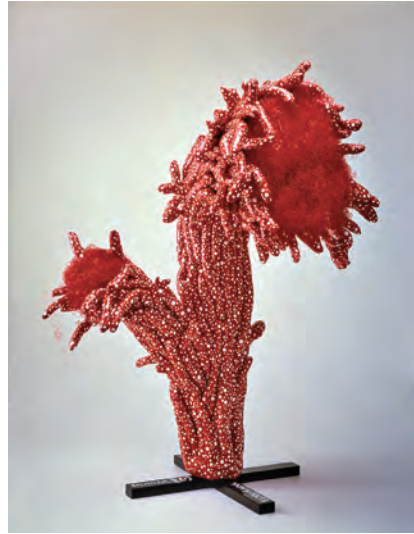
草間彌生 《夏1》 1985年

ところで改修工事にあたって美術館を悩ませる難問の一つに、工事中、作品をどのように保護するかという問題があります。温湿度の厳重な管理を必要とする美術作品を長期間収蔵する代わりの場所を探すのは容易ではありません。しかし逆転の発想として、工事期間中に作品を外部に貸し出す。さらにコレクションによる巡回展を組織す