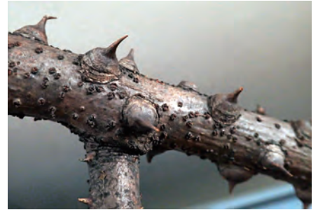
写真2:つるの乾燥標本(部分)、棘はデニムも通す