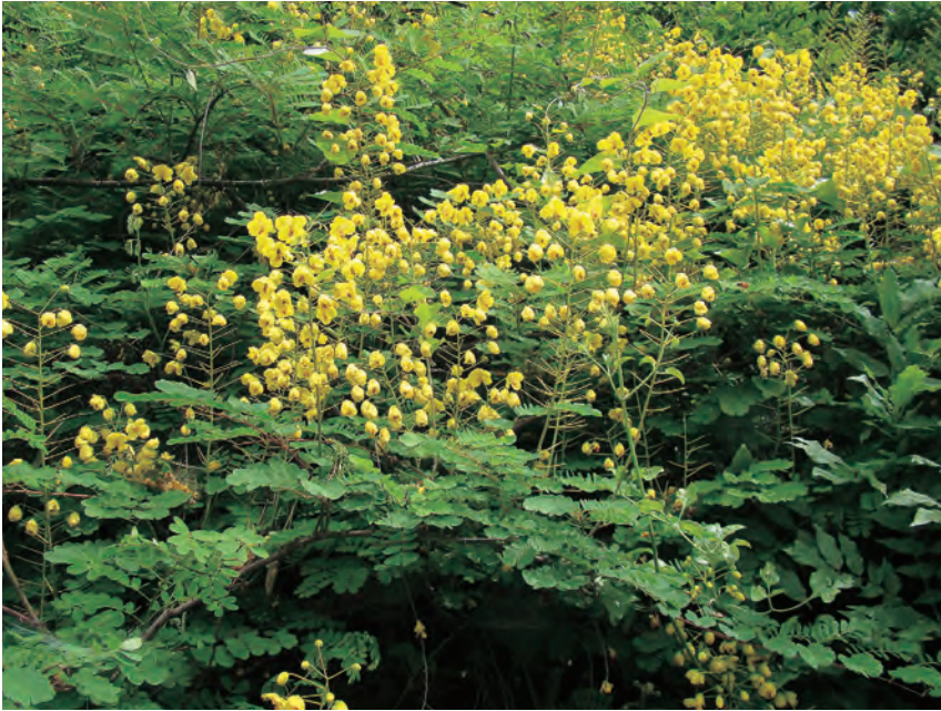
写真1:マメ科のツル植物「ジャケツイバラ」