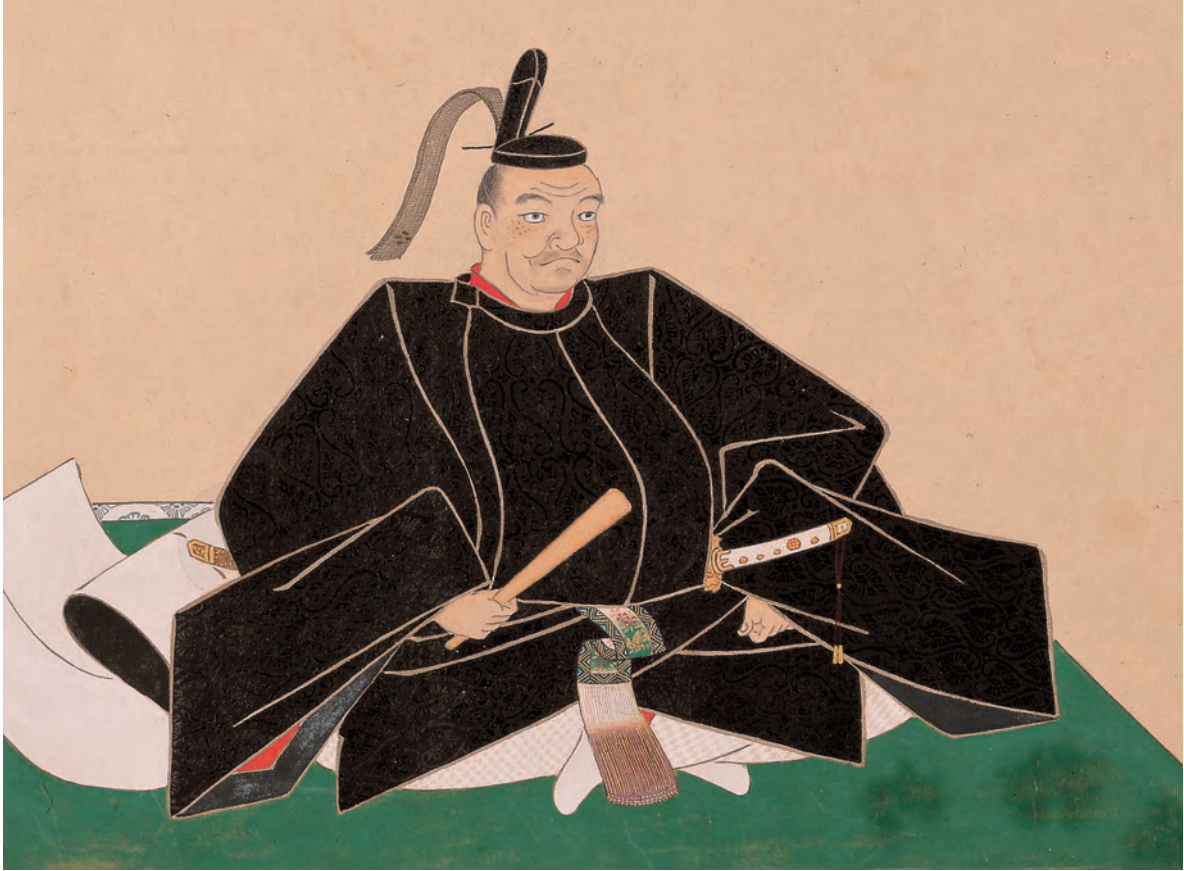
池田光政画像(「繩武像」のうち)林原美術館蔵