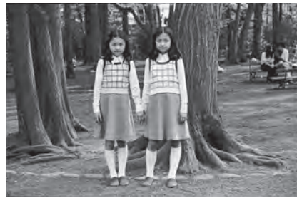
牛腸茂雄《(SELF AND OTHERS)より》1977年

界の軌跡をかたちづけてきた写真家たちの作品を改めて見つめ直すことは、日本の写真家の層の厚みを再認識するとともに、「写真」とは何かを考える機会となるでしょう。