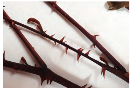
写真3:押し葉標本に見られる先の曲がった棘

鳥取県立博物館には現在、約4万点の植物標本があり、その多くは押し葉標本です。押し葉標本は乾燥した植物を、A3サイズ程度の台紙に貼り、採集地や採集者、採集日などを記入したラベルを添えたものです。