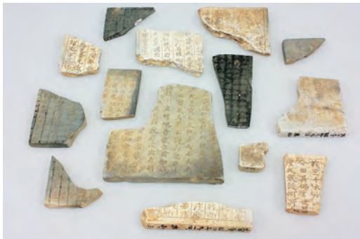
大日寺瓦経(鳥取県立博物館蔵)