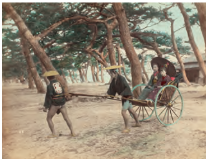
日下部金兵衛《舞子の浜の人力車》1880年代

近年デジタルカメラやスマートフォンの普及に伴い、誰もが容易に写真を撮って楽しむ機会が増えました。FacebookやInstagramなどのSNSには、日々多くの写真が溢れています。我々にとって、写真がより身近な存在になったことはいうまでもありません。一方で、従来のフィルムを使用して撮影しプリントする機会は減少の一途を辿っています。そのため、フィルムの製造を中止するメーカーやプリントラボを閉鎖する企業も少なくありません。このように「写真」をめぐる環境が大きく変化する時代において、日本の写真