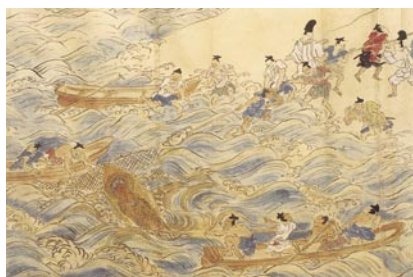
因幡堂縁起(京都市・因幡堂蔵)

この因幡堂の成立と本尊の霊験を描いた『因幡堂薬師縁起絵巻』（重要文化財、東京国立博物館所蔵、以下「東博本」）はよく知られていますが、これとは別に、東寺観智院所蔵の詞