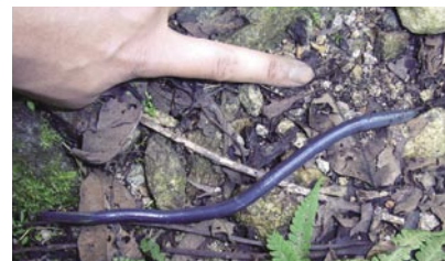
青藍色のシーボルトミズ

沢沿いの登山道では、足元の「日の当たらない」生き物たちにも目を向けてみましょう。運がよければ、土の中から出てきたシーボルトミズに出会えるかもしれません。全身あざやかな青藍色の、非常に美しいミズです。ミズとしては日本最大級の部類に入り、大きなものでは30cmを軽く超えてしまいます。「オロチ(大蛇)」とまではいかないものの、間近で見るとかなりの迫力があります。県内での正式な記録はあまり多くありませんが、船通山では、雨上がりなどに