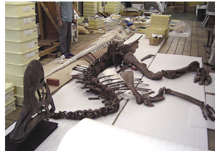
コリトサウルス全身骨格(実物:林原自然科学博物館蔵)