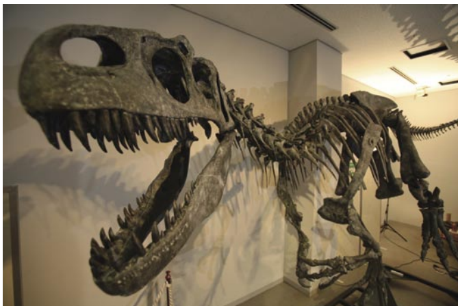
アロサウルス全身骨格(複製:林原自然科学博物館蔵)