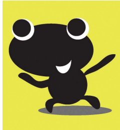
美術部門普及キャラクター 「普及のQちゃん」

このプログラムは、内容の違う4つのタイトルで構成され、博物館での美術鑑賞をより活動的なものにし、毎週土曜日に行