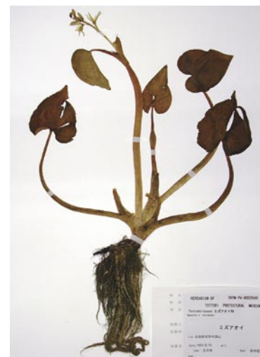
1954年8月15日に湯山池で採集されたミズアオイの押し葉標本

さらに押し葉標本は、人為的影響や外来植物の侵入により自然環境や植物相が大きく変化している現在、過去の自然環境や植物相を私たちに伝えてくれる貴重な資料です。例えば、鳥取市福部町には1958年まで湯山池という潟湖が存在していましたが、現在は宅地に変貌し、当時の様子を知ることはできません。しかし、当館の標本には1954年8月15日に湯山池で採集された水生植物のミズアオイ、カンガレイ、ガガブタの3点の標本が残されています。これらの植物の生育環境から考えると、当時の湯山池には、日当たりの良い浅瀬や湿地があり、その浅瀬には葉を水上に伸ばしたミズアオイが、湿地にはカ