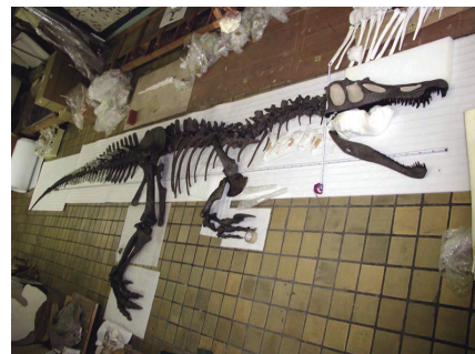
バリオニクス全身骨格(複製:林原自然科学博物館蔵)