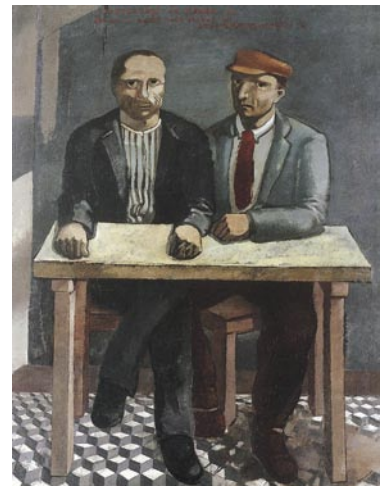
前田寛治《2人の労働者》1923年 大原美術館蔵