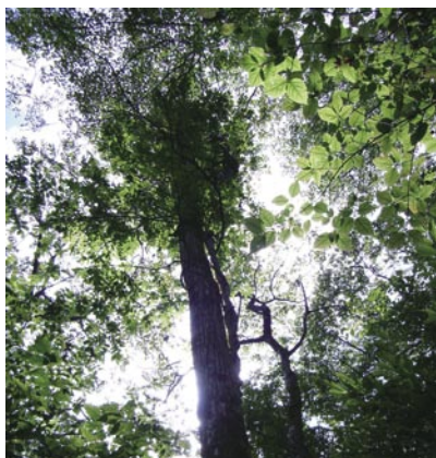
気持ちのよい落葉広葉樹の林

渓谷沿いの登山道はサワグルミヤトチノキ、チドリノキなどの自然林に囲まれ、林床にはサンインシロカネソウやラショウモンカズラといった希少な草本類を