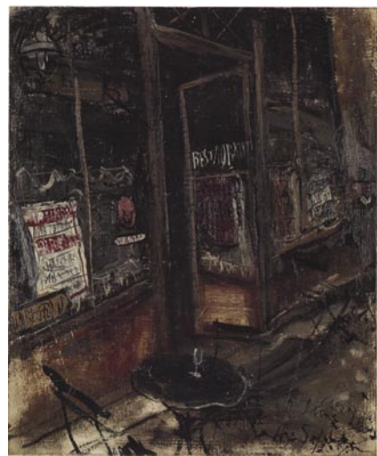
佐伯祐三《カフェ・レストラン》1927年 個人蔵