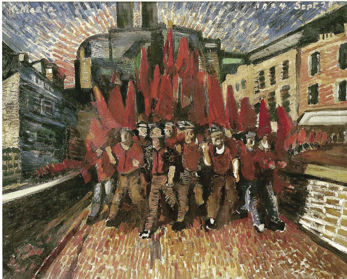
前田寛治《メーデー》1924年頃、個人蔵