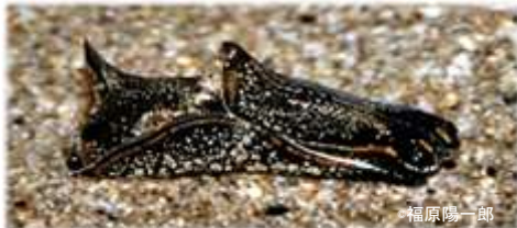
カノコキセワタ Philinopsis gigliolii

ウミウシ（海牛）は、角のような触角があることからその名がついたと考えられていますが、殻が退化した巻貝の仲間です。日本にはウミウシ類が 1400 種以上、浦富海岸には 150 種以上いると言われています。分類学的には、「軟体動物門」の「腹足綱」の 1 グループです。「軟体動物」とは、二枚貝・巻貝やイカやタコなどが含まれ、「腹足綱」はサザエやアワビ、カタツムリなどの巻貝類が含まれるグループです。ウミウシはその中の「後鰓類」と呼ばれる動物の総称で、その名の通り、体の後ろ側に鰓があるのが特徴です。しかし、種類によっては鰓が体に覆われて見えないこともあります。（裏に続く）