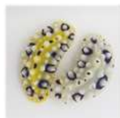
キイロイボウミウシ Phyllidia ocellata