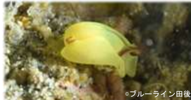
キイロウミコチョウ Siphopteron flavum