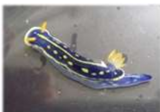
アオウミウシ Hypselodoris festiva