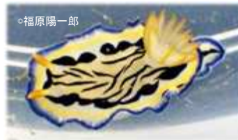
リュウモンイロウミウシ Hypselodoris maritima