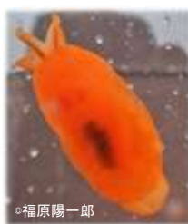
ホウズキフシエラガイ Berthellina citrina