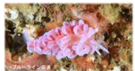
サガミミノウミウシ Phyllodesmium serratum