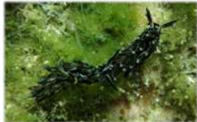
クロモウミウシ Aplysiopsis nigra