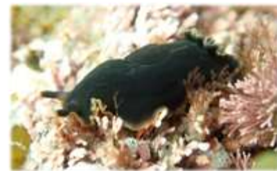
クロシタナシウミウシ Dendrodoris fumata