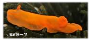
キヌハダウミウシ Gymnodoris inornata