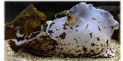
アマクサアメフラシ Aplysia juliana