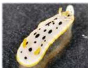
シロウミウシ Chromodoris orientalis