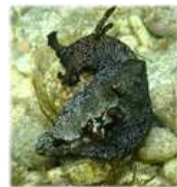
アメフラシ Aplysia kurodai