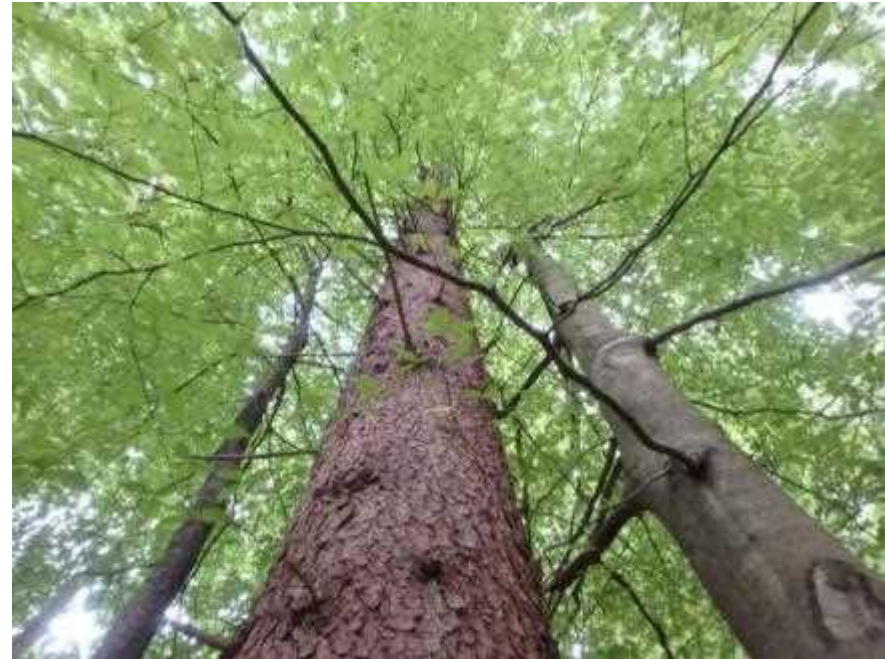
トウヒとブナの混交林