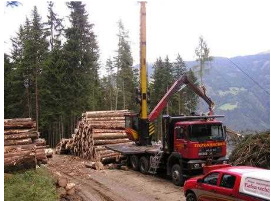
大型の機械・車両が走行可能