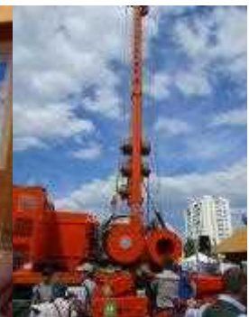
マイヤーメルンホフ社