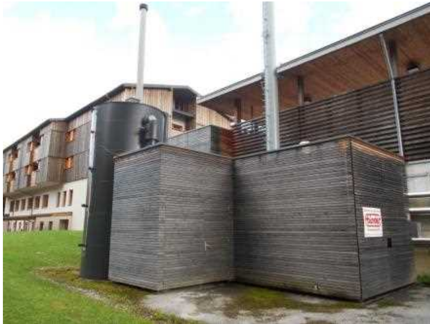
オシアツハ森林研修所ボイラー (500kW)