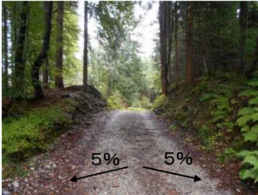
カマボコ型で路面排水良好 転圧された頑強な路盤工