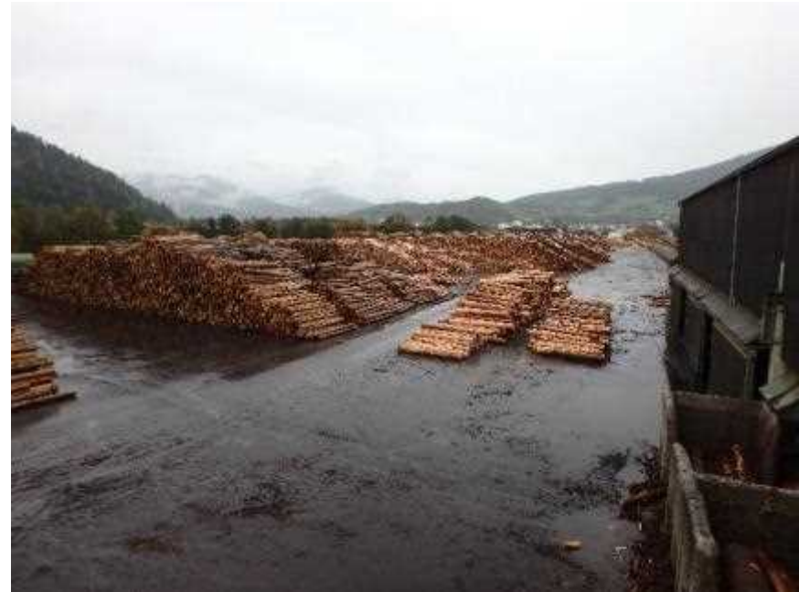
7万本のストック(2週間分)