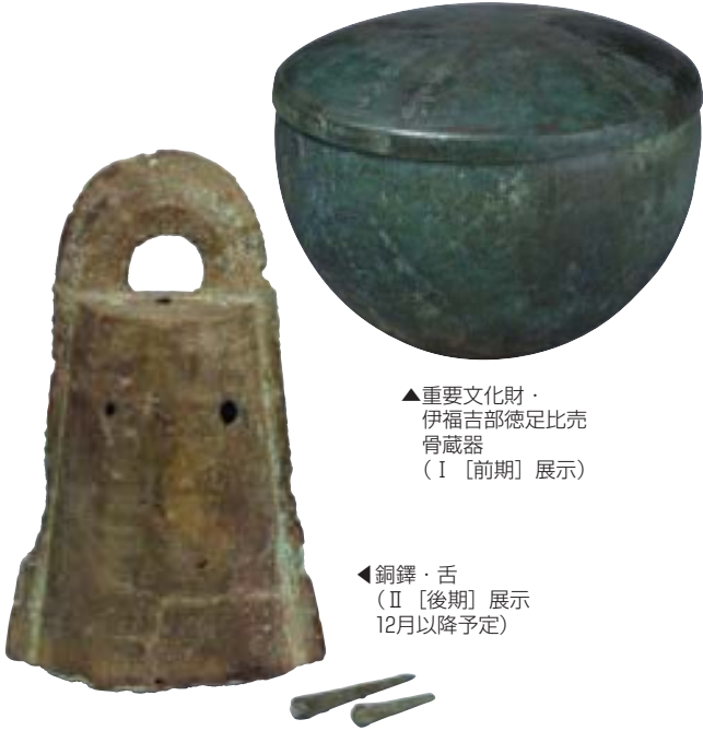
▲重要文化財・ 伊福吉部徳足比売 骨蔵器 (Ⅰ〔前期〕展示)