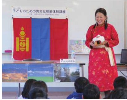
子どものための異文化理解体験講座