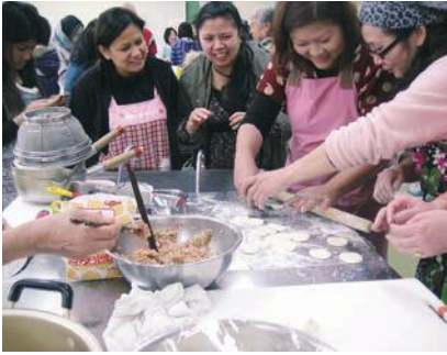
外国人講師による料理交流会

新しい事務所では、鳥取駅南という地の利を活かし、これまで以上に関係機関との連携を深めるなど、新たなニーズを踏まえた事業を構築していきます。また、県内随一の日本語学習教材などを活用し、コミュニケーション（言葉）の支援や人材の育成など、これまで蓄積したノウハウを活かしたサービスの充実を図るとともに、県民の国際理解を進める事業を地域に出かけて実施するなど、これまで以上に財団の存在を身近に感じていただけるような事業を展開していきます。どうぞご期待ください。