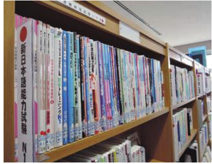
充実した日本語学習教材