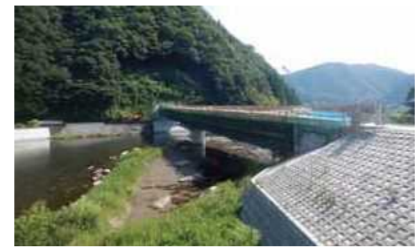
▲洲河崎大橋の工事状況(2016/8)