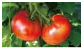
▲日南ブランドの代表「にちなんトマト」(日南町)