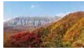
▲大山を眺める絶景ポイント「鍵掛峠」(江府町)

*江府三次道路は、米子自動車道や中国縦貫自動車道、山陰自動車道、松江自動車道などと一体となって地域の循環型ネットワークを形成する道路です。鳥取県日野郡江府町と広島県三次市とを結ぶ延長約90kmの路線であり、平成6年12月に地域高規格道路の計画路線に指定されました。