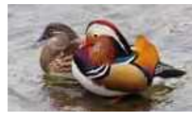
▲貴重な水鳥を間近で観察できる「オシドリ」(日野町)