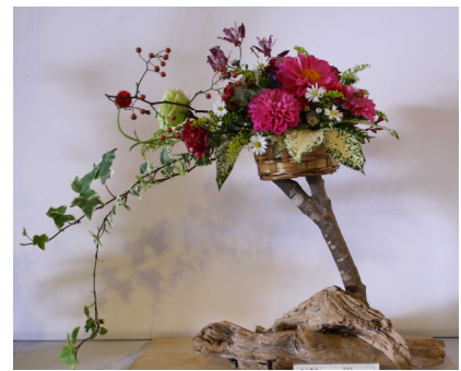
左 : プロ部門 鳥取県知事賞 木村容子 (木村生花店) 中央: 高校生部門 鳥取県知事賞 福本美樹 増野恵 井上莉沙 (倉吉農業高校) 右 : 人気投票第1位 高校生部門 牧野竜二 (日野高校)