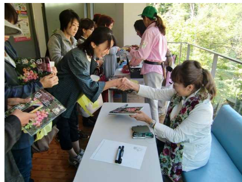
◎押し花を使った小物づくり（講師：華工房ブーケ）