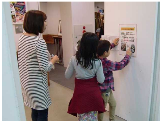
フラワークイズラリー