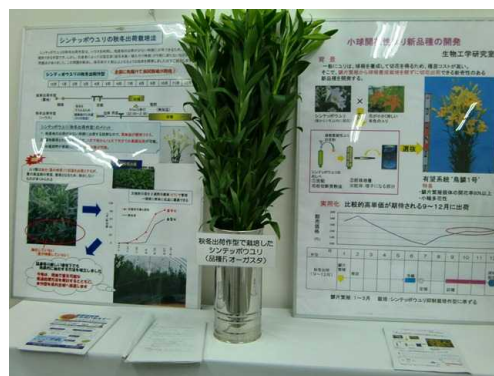
園芸試験場 成果展示