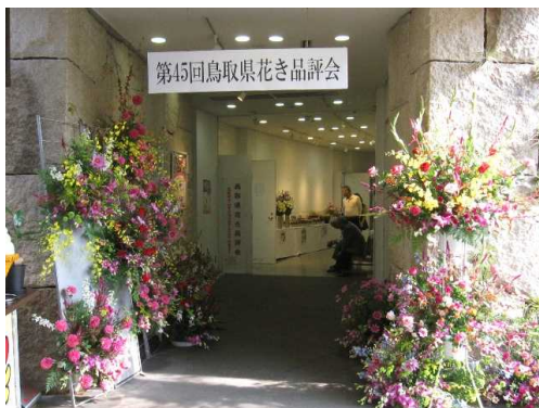
米子花商園芸組合 装花