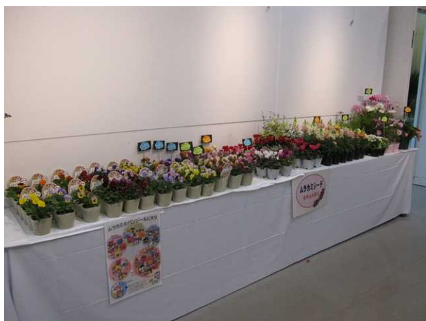
(株) ムラカミシード